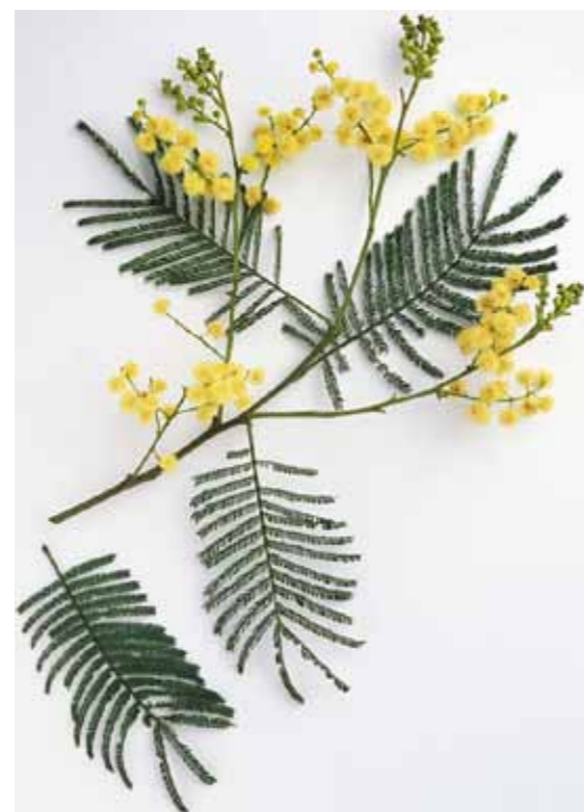
Figura 1 - Rama de Acácia Negra ( Acacia meansii ).

Os taninos produzidos por esta variedade de árvore se classificam como tanino condensado e/ou catequínico. É um composto polifenólico que possui uma vantagem frente aos outros polifenóis naturais: a facilidade em reagir e precipitar proteínas.