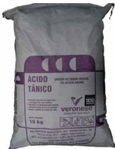
Figura 4 - Produto "Ácido Tânico" comercializado pela Veronese & Cia. Ltda.