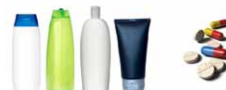
Figura 5 - Mercados que utilizam Taninos: vitivinicultura (uva, vinho), alimentos (chás, ervas), cosméticos (xampus, colorantes) e fármacos.