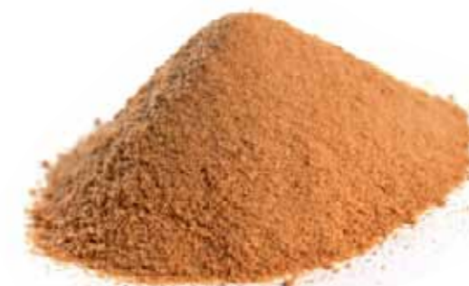
Figura 3 - Extrato Concentrado de Tanino Condensado (Ácido Tânico) - Veronese Produtos Químicos.

Estes taninos são polímeros de 2 a 50 (ou até mais) unidades flavonóides com ligações carbono-carbono, as quais são suscetíveis de serem rompidas pela hidrólise. Suas estruturas básicas chamam-se flavan-3, 4-diol e o flavan-3-ol, com peso molecular é de 500 a 2.000. Apesar de muitos dos taninos condensados serem hidrossolúveis, alguns de grande dimensão (cadeia carbônica longa), são insolúveis na água.